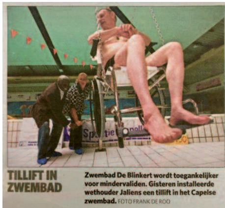
Ook De Blinkert had een tillift

In een aantal vooroverleggen is de BGC participant geweest om de gemeente te adviseren aandacht te geven, qua inrichting van het nieuwe zwembad, aan de mens met een beperking, zodat ook zij gebruik kunnen maken van het nieuwe zwembad. Bij het slaan van de eerste paal was de BGC niet uitgenodigd, maar daar liggen wij niet wakker van: het gaat uiteindelijk om het gebruik van deze