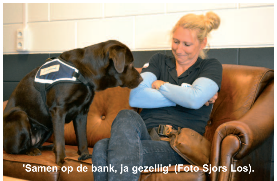
'Samen op de bank, ja gezellig'.